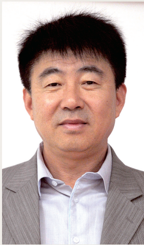
本届武术节竞赛部部长 郑州市体育局局长 李庆山