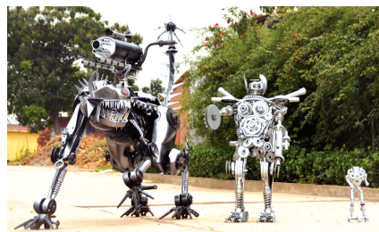
欣赏一下仨小伙做的机器人