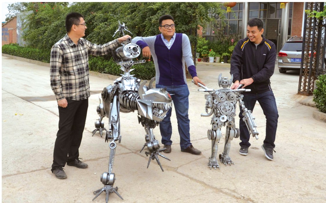
大学生合伙人,设计制作变形金刚开启创业之路