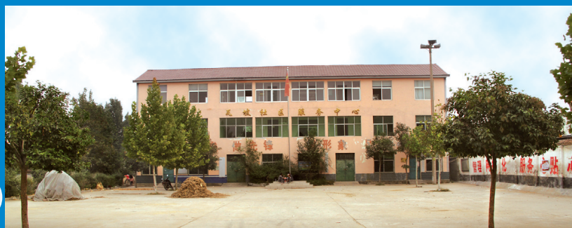
现瓦坡村村委外景