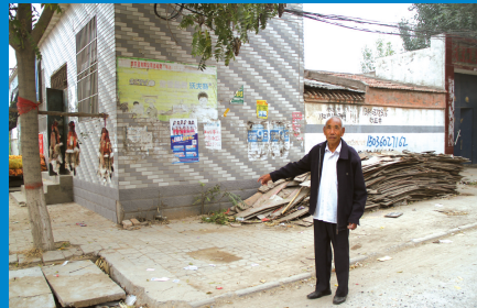
村民所指之处为瓦坡村古寨墙旧址