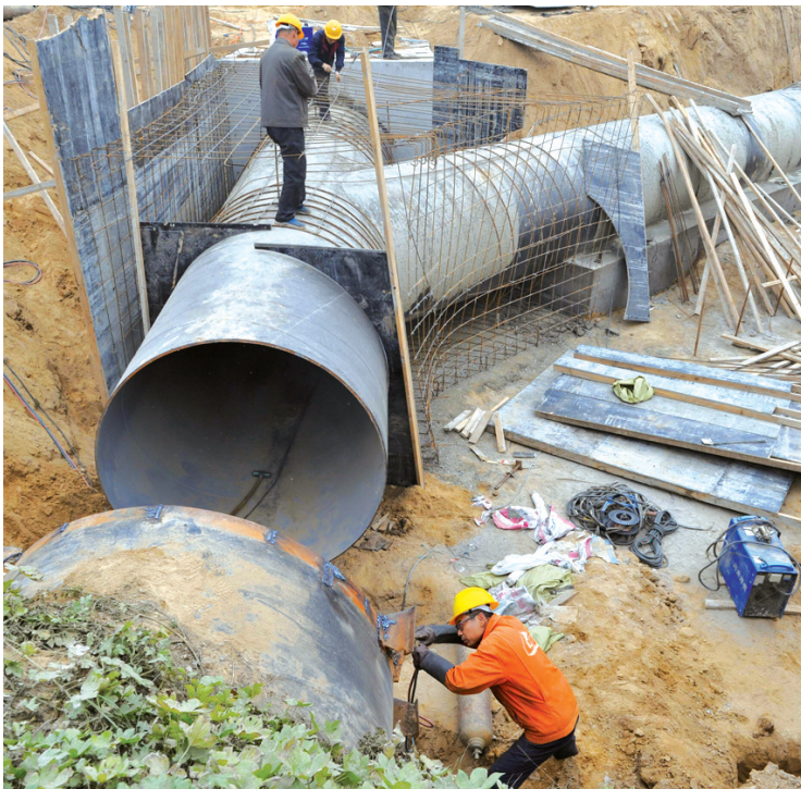
刘湾水厂与南水北调输水管道碰通施工现场

因南水北调输水管道与刘湾水厂进厂原水管道碰通,施工将进行3天,时间为10月30日上午10时至11月2日上午10时,为配合施工,刘湾水厂将停产三天,刘湾水厂供水区域为航海路以南、京广路以东及原南部低压区域,将降压供水,请以上区域用户做好储水准备。此次碰通,刘湾水厂将具备引入丹江水后的通水能力,只等丹江水的到来。