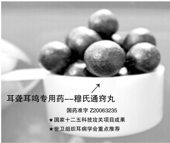
耳聋耳鸣专用药——穆氏通窍丸