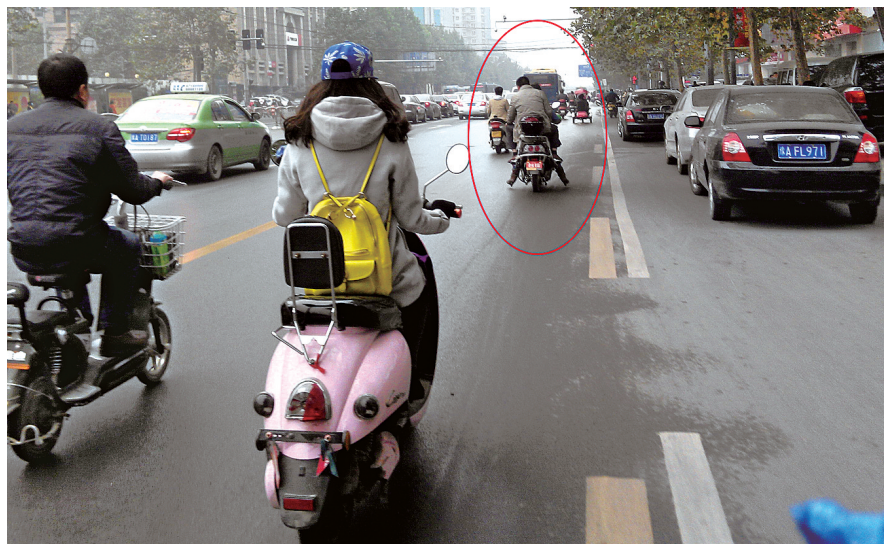
女摩的司机骑得飞快,闯了3次红灯