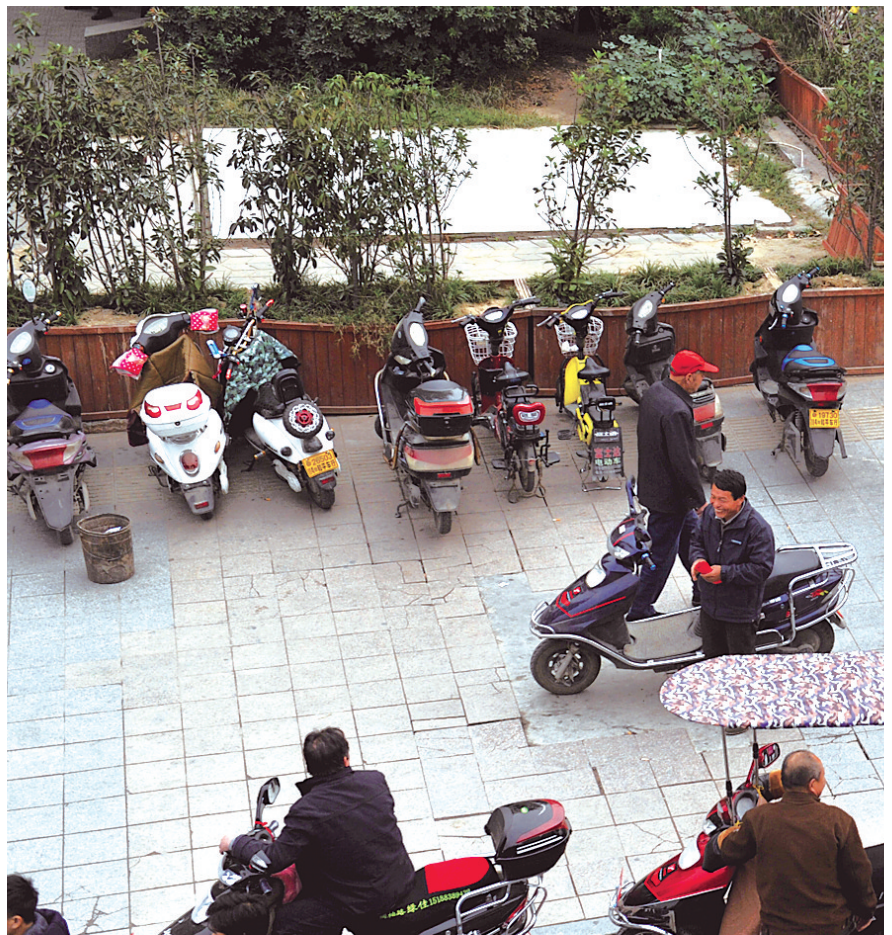
等活的摩的“包围”紫荆山地铁口

郑州晚报记者 鲁燕 张翼飞 张玉东 实习生 李钟鸣/文