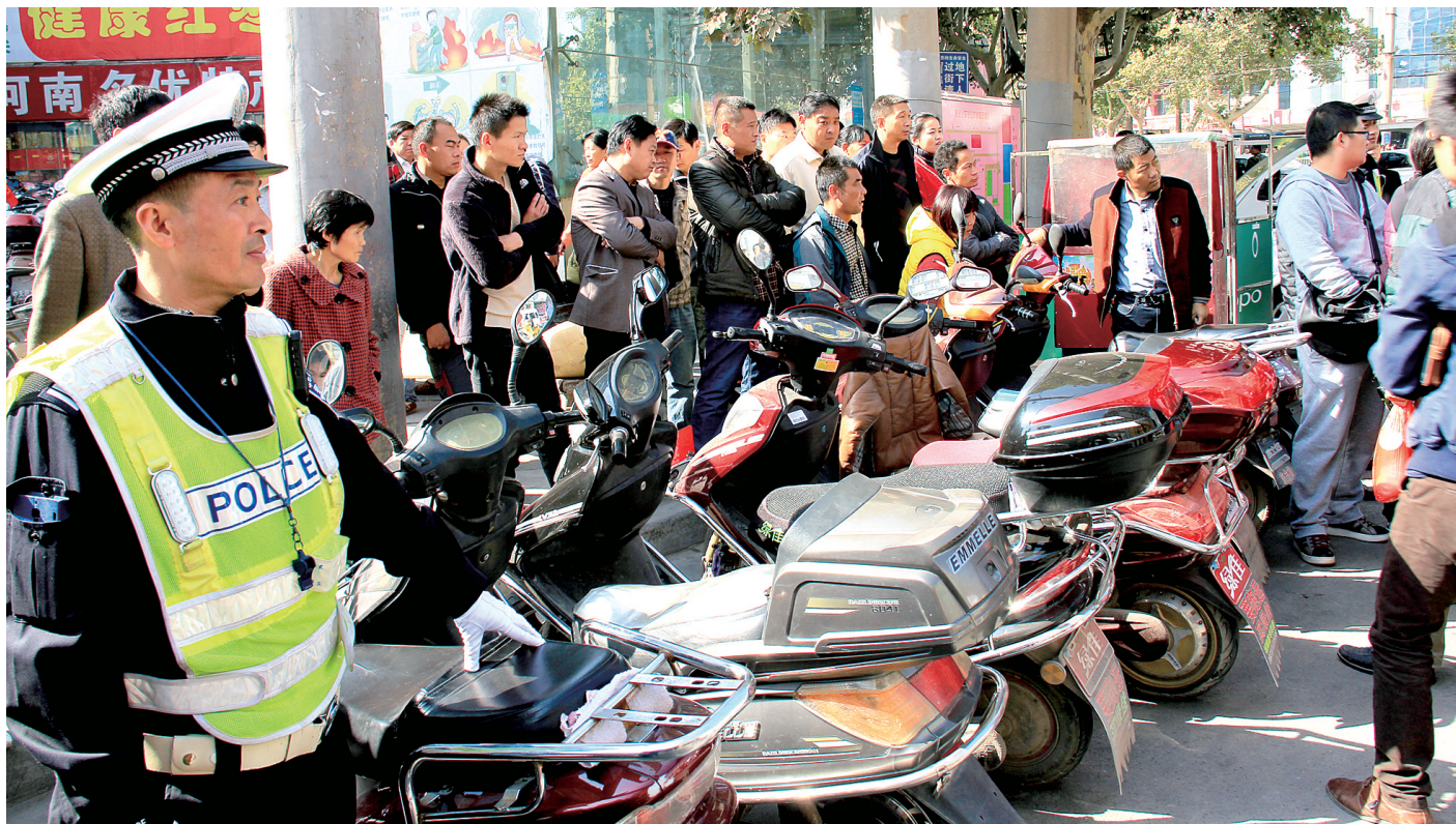
摩的被执法人员暂扣。

从11月3日起,本报连续对黑摩的进行了报道,引起社会各界的强烈反响。不少市民致电本报,希望有关部门坚决打击黑摩的,并提出了一些不错的建议。