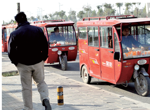
昨日上午,在地铁体育中心站,摩的不见了,机动三轮运营摩托车却很多。