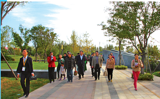
来自全国各地的知名作家对中牟日新月异的新变化赞叹不已