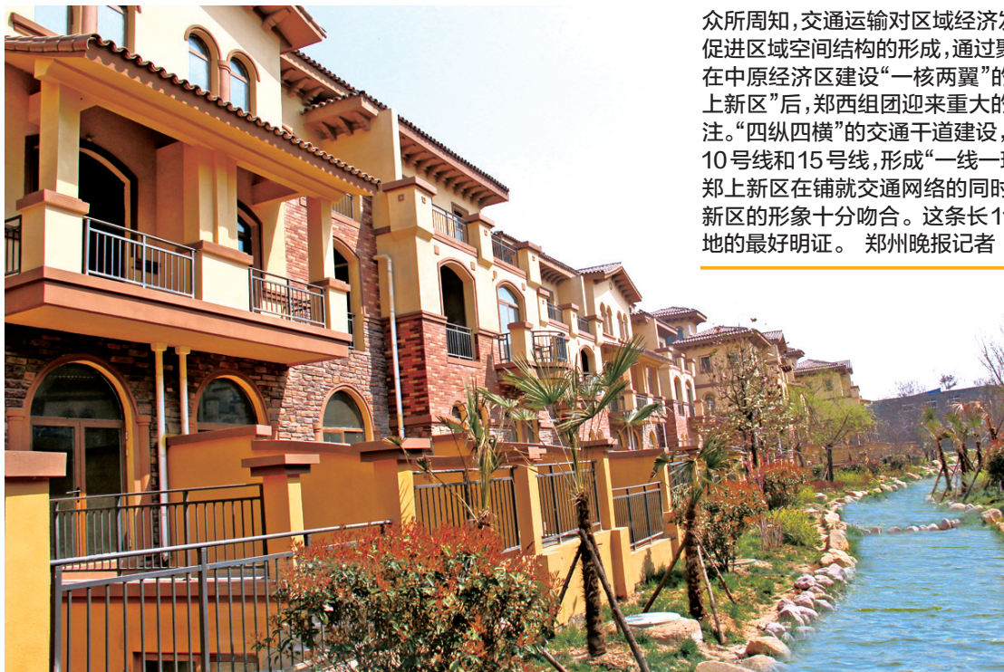
清华·大溪地实景图

众所周知,交通运输对区域经济发展有巨大作用,交通运输的发展不仅影响经济活动的区位选择,而且促进区域空间结构的形成,通过聚集和扩散效应,推动区域经济协调发展。