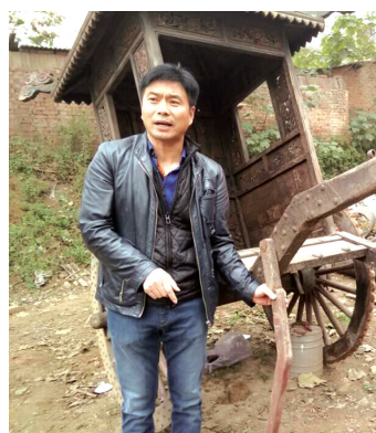
“乾隆年间马车”现身新郑街头