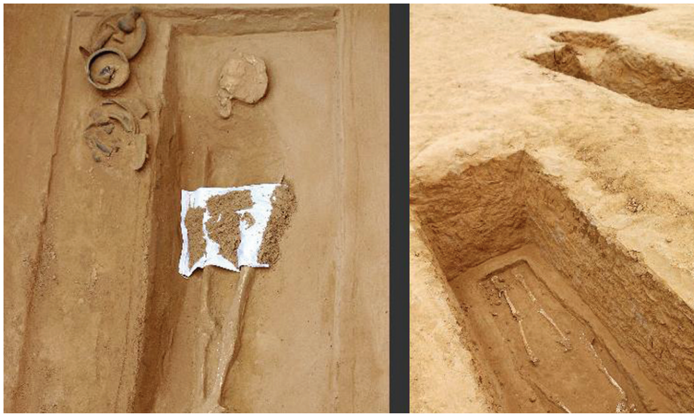
墓穴中还可以看到逝者的遗骸

墓穴达成年人两人多高,均是砖石墓和土墓 已发掘古墓100余座,出土了陶鼎、陶豆、陶盘等文物