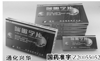
通化兴华 国药准字 Z20055052

“止咳平喘健康行”公益救助活动正好来到我市,患者只需拨打厂家订购电话购买。本次活动由世界哮喘病医学协会促进发起,是全国公益性活动,国家高度重视,发文要求重点推广。