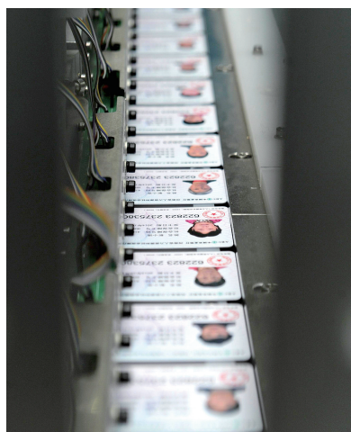
省社会保障卡初始化中心正在流水制作新的社会保障卡。