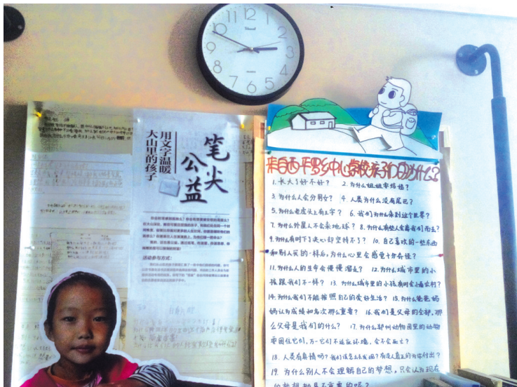
书店里“笔尖公益”的宣传海报和孩子们的问题