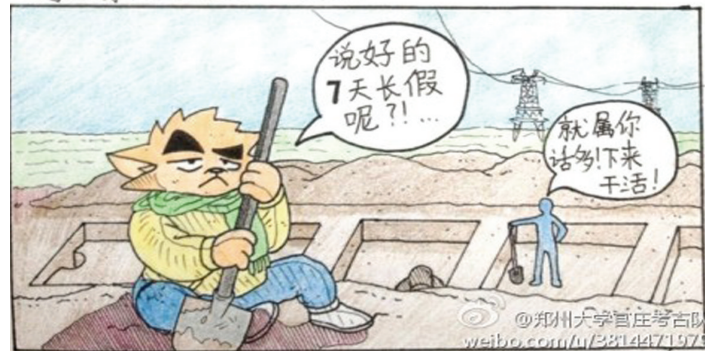
对于吃苦耐劳的考古人来说,所有的放假与不放假都是妄想?向所有假期还在岗位上的考古人致敬。