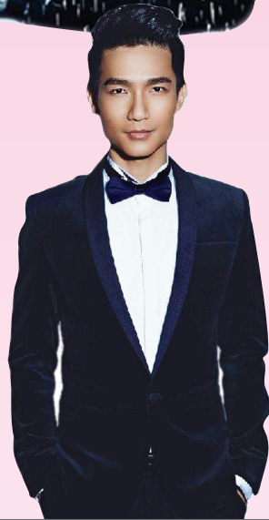
明年1月来郑州开演唱会