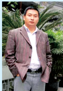
管城区市民记者 班计划