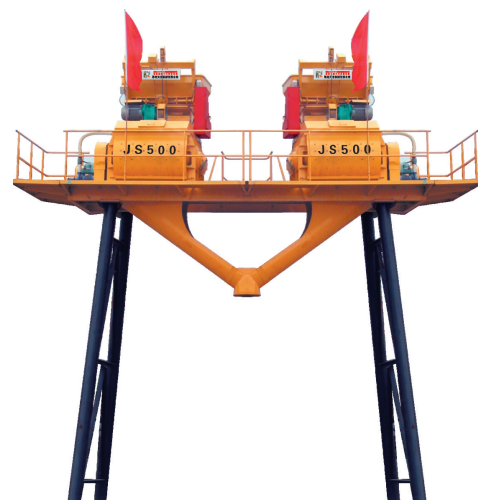
JS500 型双联体混凝土搅拌机