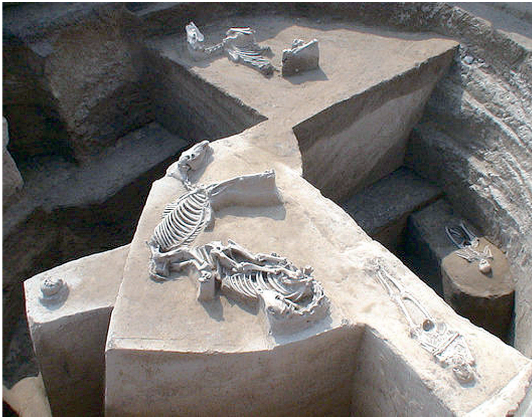
娘娘寨遗址发掘祭祀坑