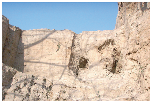
娘娘寨遗址文化层