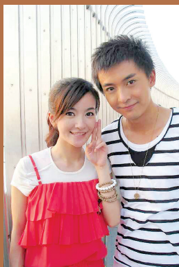
李佳航和李晟交往4年

昨日演员邓家佳(就是《爱情公寓》里的“小姨妈”唐悠悠)在微博宣布与相恋10年的圈外男友在澳洲举行婚礼,婚纱大片也随即曝光。据悉,两人是在朋友聚会上一见钟情的,新郎是某品牌创始人。两人相恋10年,包含5年异地恋情,其间仅靠E-mail联络感情。这是继“吕子乔”孙艺洲、“曾小贤”陈赫结婚之后,《爱情公寓》的第三件婚事。“小姨妈”结婚消息传出,许多粉丝大呼:“异地恋靠E-mail维持感情,我又相信爱情了!”此外,“小姨妈”与男友10年的爱情长跑经历,也让粉丝们惊奇发现,“孙艺洲曹晓雯恋爱9年登记结婚,邓家佳和男友相恋10年举行婚礼,陈赫许婧相爱13年结束爱情长跑。长情的爱情公寓。满满的都是爱呀。”