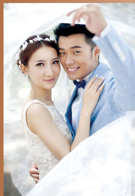
陈赫娶了交往13年的女友