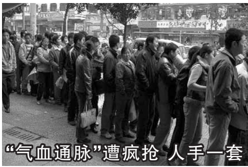
“气血通脉”遭疯抢 人手一套