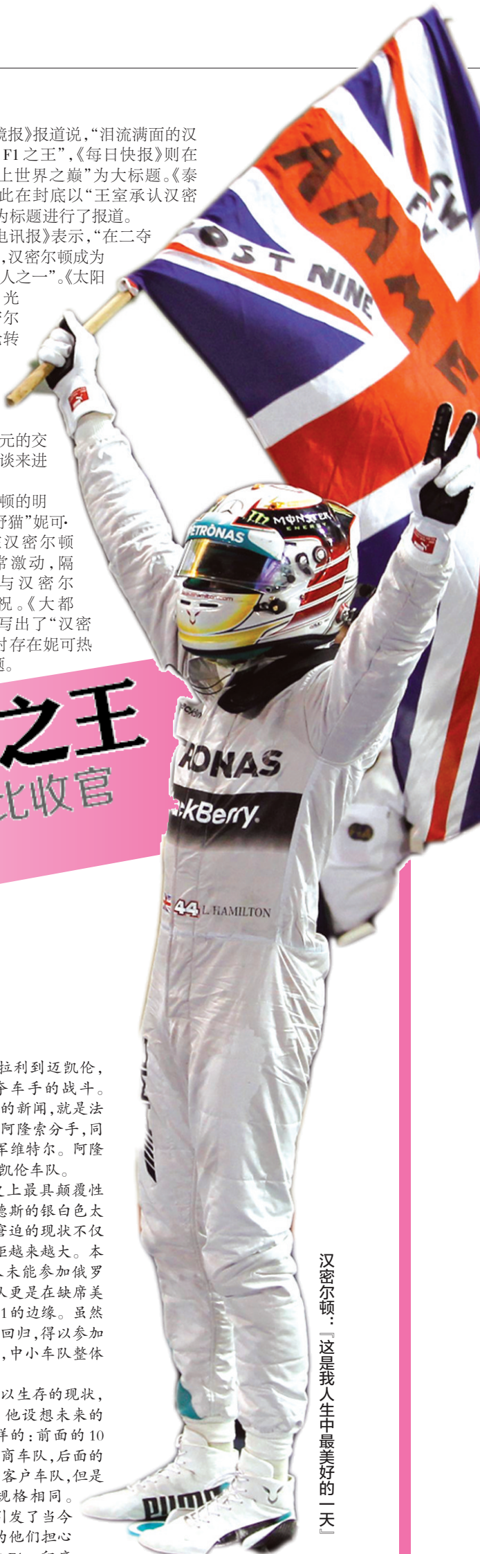
汉密尔顿:「这是我人生中最美好的一天」

在取得F1史上最压倒性胜利时,梅赛德斯车队负责人托托·沃尔夫坦言,赛车的功劳占90%,车手功劳占10%。但是其他豪门显