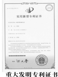
重大发明专利证书