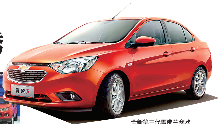
全新第三代雪佛兰赛欧

LED光源,提升照明效果与辨识度。日前召开的APEC工商领导人峰会上,荣威950就作为国宾车为与会贵宾提供服务。自2007年荣威品牌发布以来,至今累积销量超过70万辆。