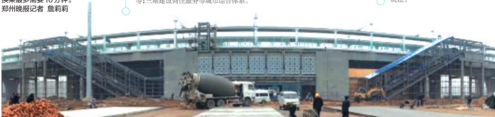
宋城旅游客运站外景。

为方便旅客乘坐出租车,宋城旅游客运站计划从全市出租车中挑选150辆示范标兵车进站营运。对于那些自助游开封的旅客,宋城旅游客运站还将创新性地开通两条旅游专线车线路,采取单线循环双向运营的方式,让旅客在半小时内到达开封任一景区。而且,旅游专线车实行一票制,旅客购票后可在一天内随意乘坐,根据定时班车时间自行确定游玩每个景区的时间,为自助游的旅客提供“开封一日游”的新玩法。