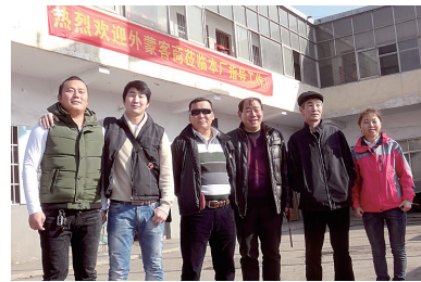
蒙古客户参观新巨威公司