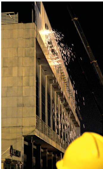
郑州晚报记者 周甬 图