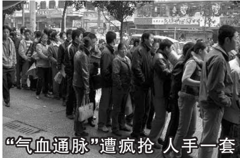
“气血通脉”遭疯抢 人手一套