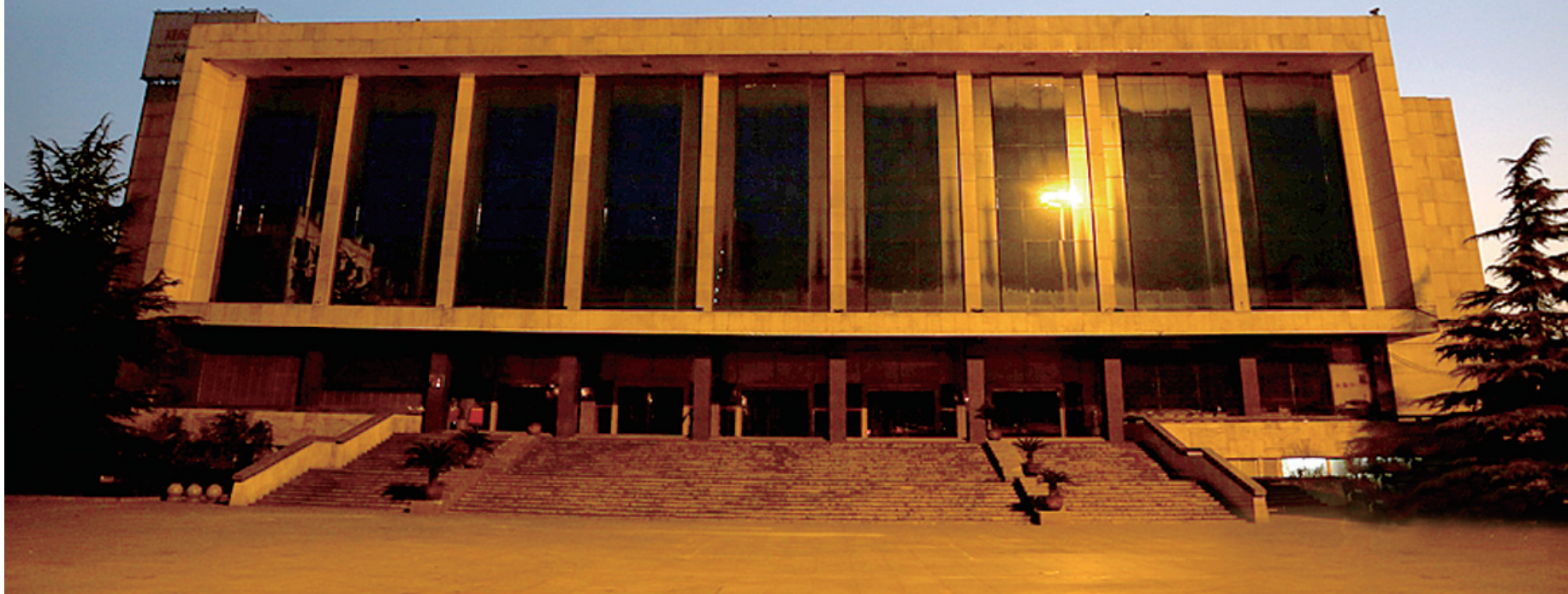
昨日凌晨 灯光照射下,省人民会堂甩掉繁杂,重拾庄严