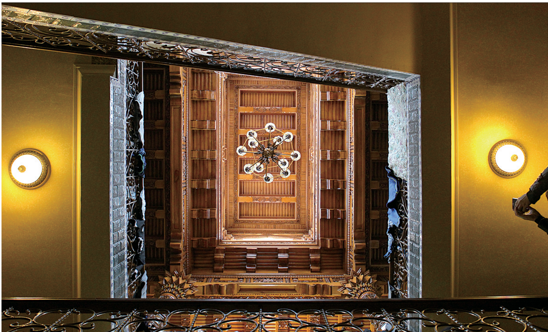
在喀什居民阿不都米吉提家中,游客正在拍摄精美的天井,这在当地原居民家中并不罕见。如果不进来,很难想到主人生活如此精致。