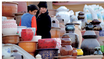
各类自发形成的巴扎(集市)秩序井然地分布城区内,紧密相连互不干扰。这是花篮巴扎。