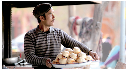
当地美食以“烤”见长,包子烤得皮酥馅嫩。