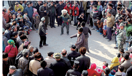
人们生活安逸,兴致来临就随时随地起舞。