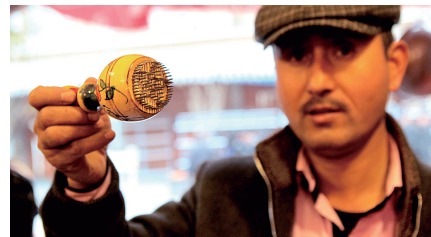
喀什的铜器、木器等手工业繁荣,就连制作馕饼的小工具也加工得如工艺品一般精致。