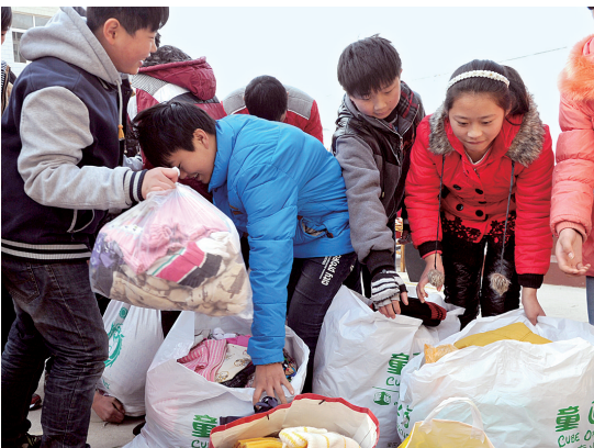
爱心人士为学生们带来书籍