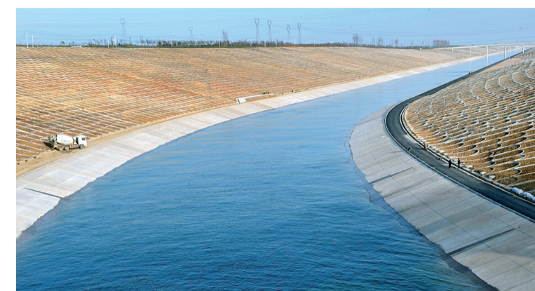
昨日下午,清澈的丹江水从渠首闸门沿南水北调干渠,流向北方。