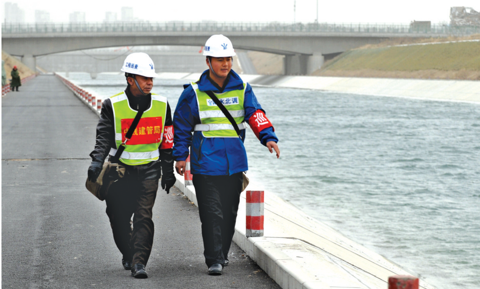
南水北调郑州管段安全员在渠边巡检。

“南方水多，北方水少，若有可能，借一点来也是可以的嘛。”1952年10月30日，毛泽东在郑州邙山遥望着滚滚东去的黄河水说。昨天，这句话变成了现实。昨日上午，随着闸门徐徐升起，南水北调水进入我市刘湾水厂。省委书记、省人大常委会主任郭庚茂宣布：河南省南水北调工程正式通水。