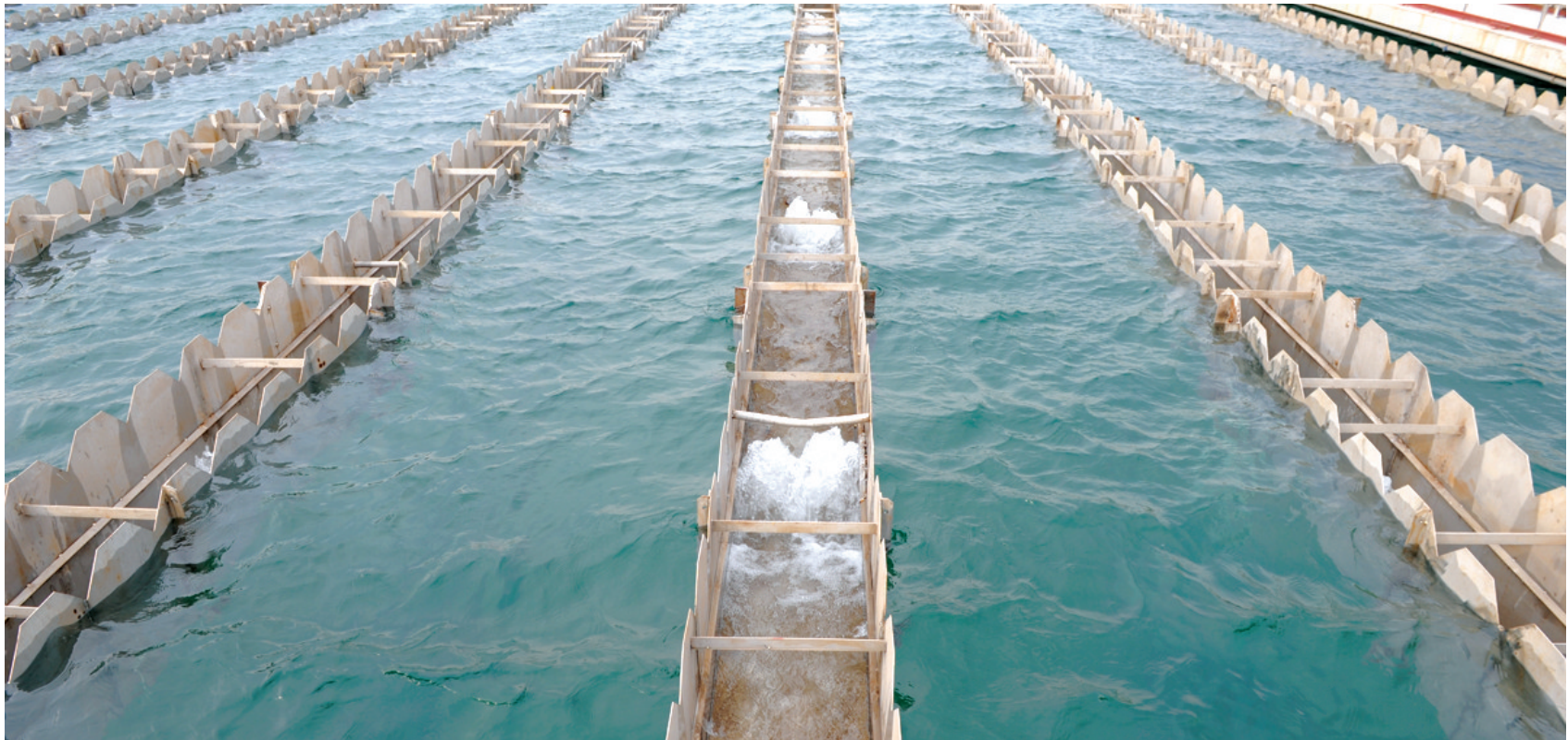
郑州刘湾水厂沉淀池内,清澈甘甜的丹江水正在不断涌入。

丹江水比黄河水更甘甜,不易出水垢,浑浊度低 家里如果出黄水,开水龙头放几分钟就好了