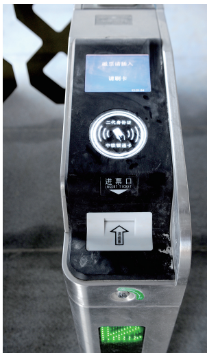
可以刷身份证进站的闸机