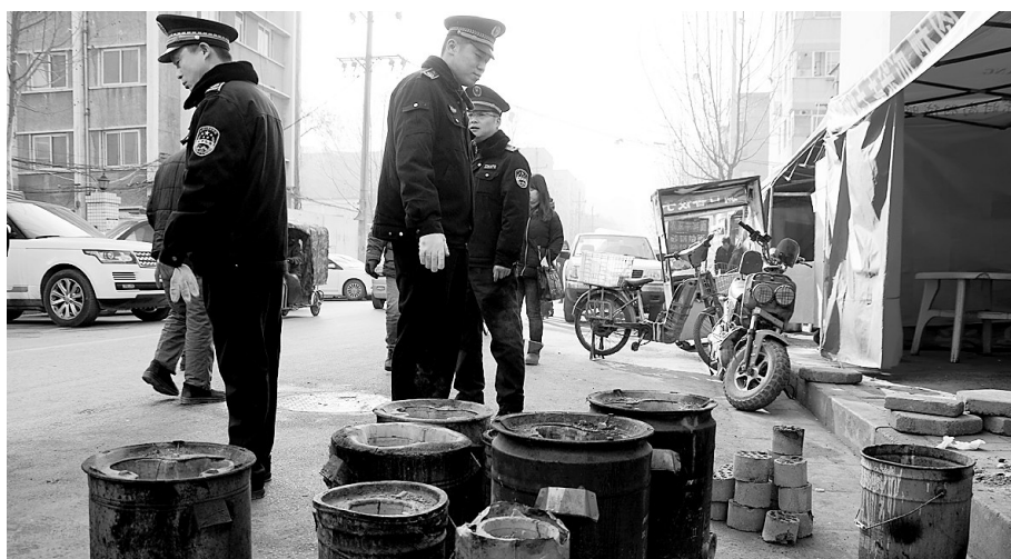
凌云路多家饭店违规使用燃煤炉灶被查处

我市交通秩序整治“百日行动”将持续到明年3月10日,公安、交通、城管、城建等部门将联合行动,规范城区道路交通工程施工秩序,清理各类影响交通的占道经营、马路市场,严厉打击非法营运车辆,严查机动车乱停乱放和非机动车、行人乱闯红灯等行为。 昨日,郑州市城市管理局对各区清理取缔占道经营工作取得的成效进行通报,金水区省胸科医院周边、管城区未来路商城路区域、二七区棉纺路段的占道情况得到清理或制止。