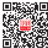
关注“郑州晚报家电” 获得权威家电信息