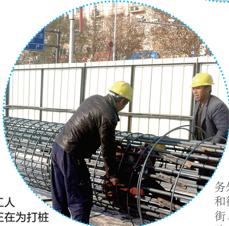
工人正在为打桩作准备