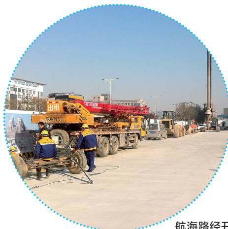
航海路经开第三大街东南角围挡内,不少工程车已进入

12月18日凌晨3时30分,随着旋挖钻机的轰鸣声,郑州市经开第三大街站主体工程围护桩的首桩顺利灌注完成,这标志着郑州地铁5号线土建工程建设正式拉开序幕,中铁七局五公司也成为全线12个标段率先开工的承建商。 郑州晚报记者 张玉东 詹莉莉 文/图