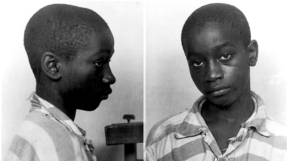
乔治·史蒂尼(资料图)

美国南卡罗来纳州一位法官日前作出迟来的平反,撤销70年前遭处决的一名黑人青少年的死罪。这名青年被控谋杀2名白人少女,经草率审判就被送上电椅处死,成为美国最年轻死刑犯。