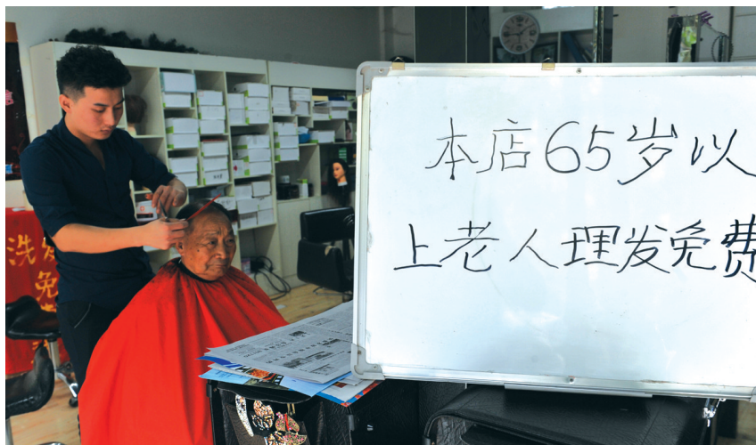
凌云路与城北路口西南角“木子发型”理发店,为65岁以上老人免费理发。

进入理发店掏钱理发,这是理所应当的事儿。可是,在郑州却有一些“另类”理发店,为老人理发却不要钱,他们用微小的举动感动了很多,传播着正能量,赢得了交口称赞。郑州晚报记者 石闯/文 周甬/图