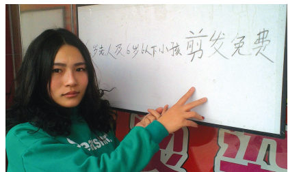
纬三路小学对面“美格”理发店,店长为老人及幼童免费理发。