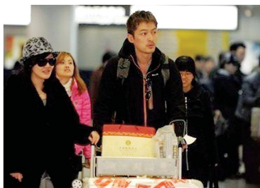
薛佳凝、胡歌2011年曾传“复合”