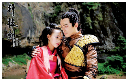
唐嫣胡歌是荧屏情侣档