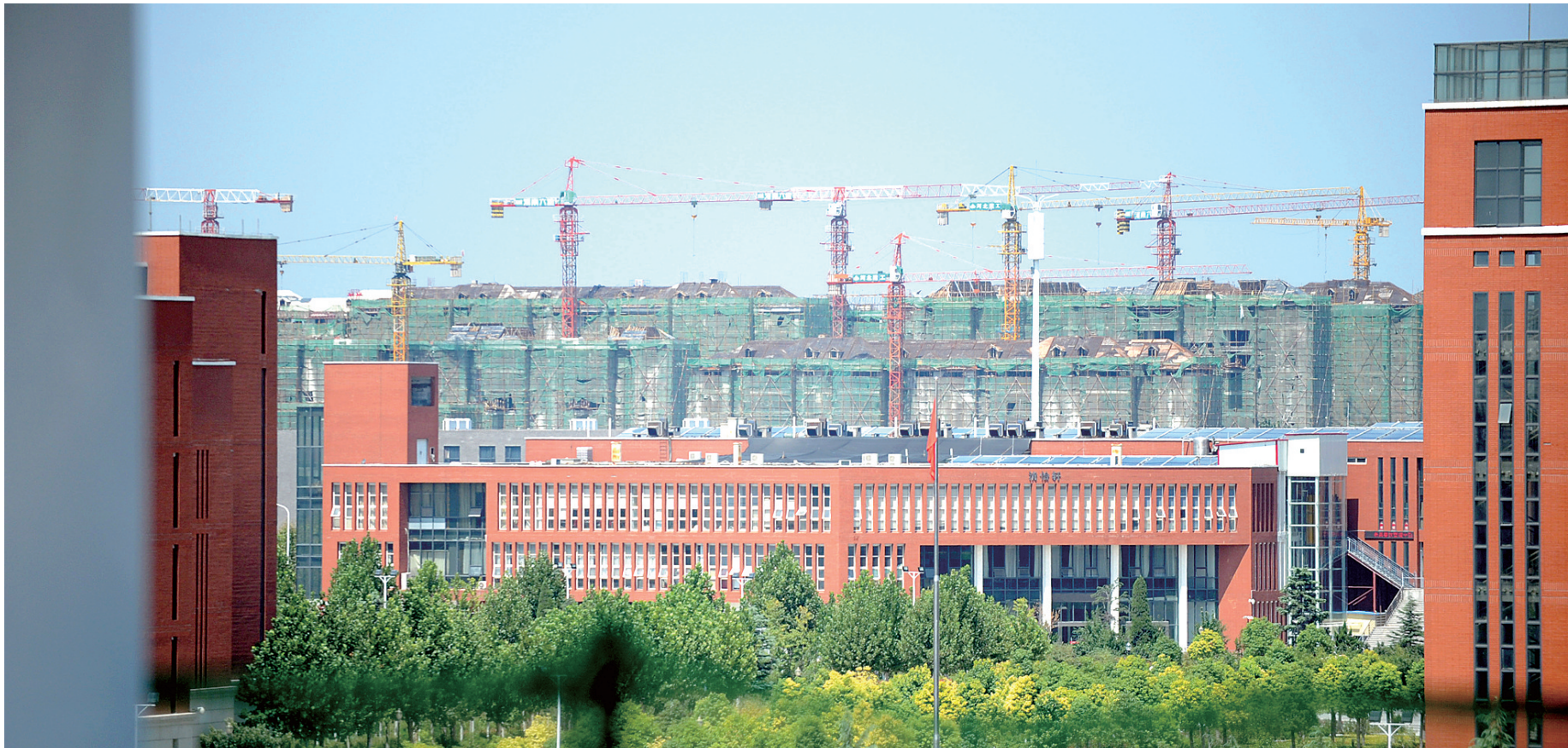
未来,每个站点都将是商业圈

“要想富,先修路。”“火车一响,黄金万两。”安全、便捷、环保、节约、高科技的城际铁路,令两座城市脉搏同频,居民生活质量提速。