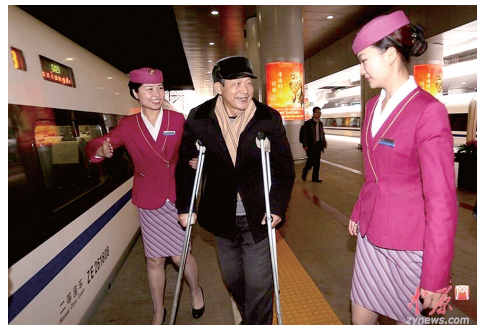
闺女,真俊。