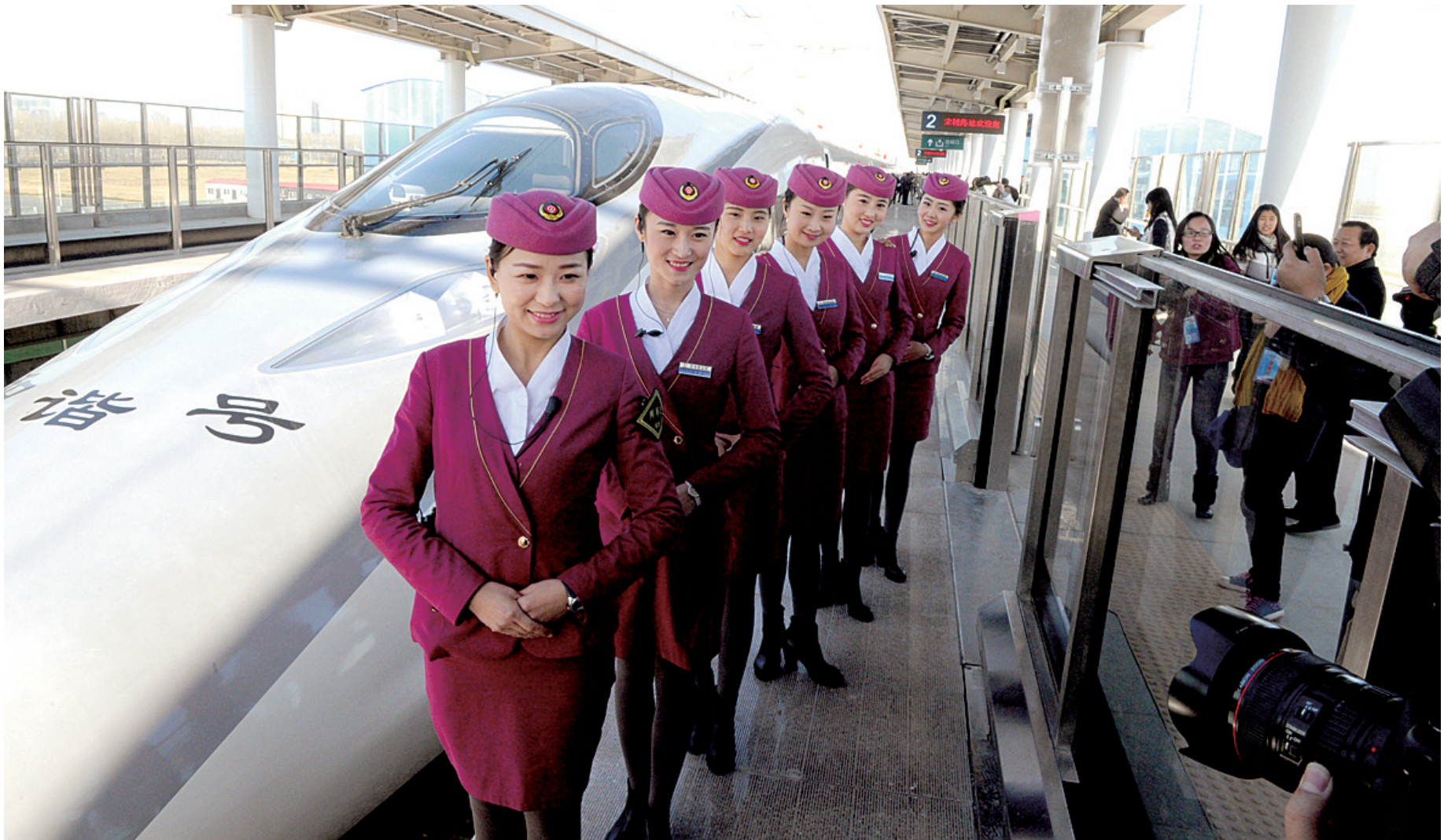
有这样的美女迎接,上车心情倍儿好。