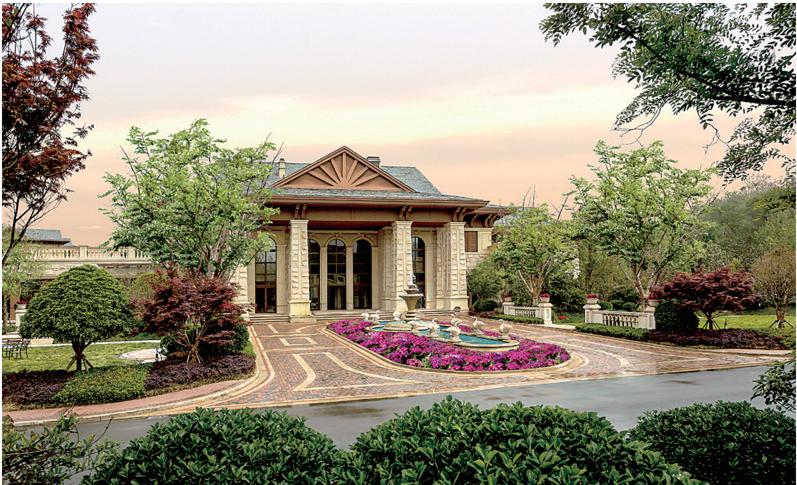
思念·果岭5期悦莊实景图

成立于2003年的中部大观地产，从跨界进入房地产领域并成功运作“思念·果岭山水”开始，历经了11年的深刻积淀。