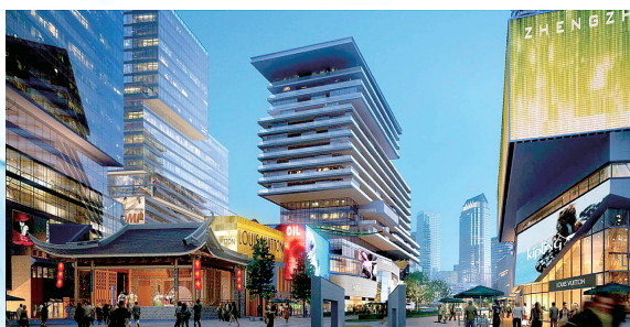
城市综合体代表含嘉仓效果图