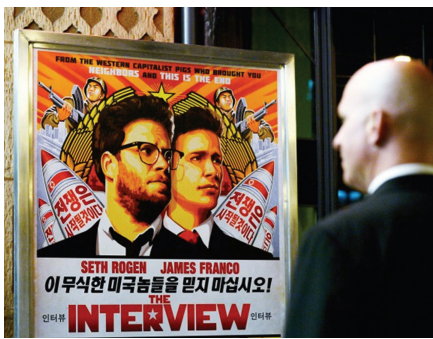
影院里的大幅海报