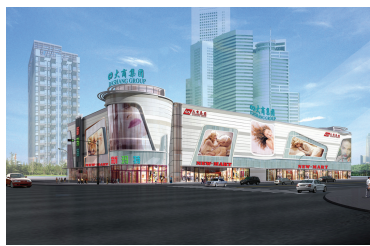
商丘一、二期效果图