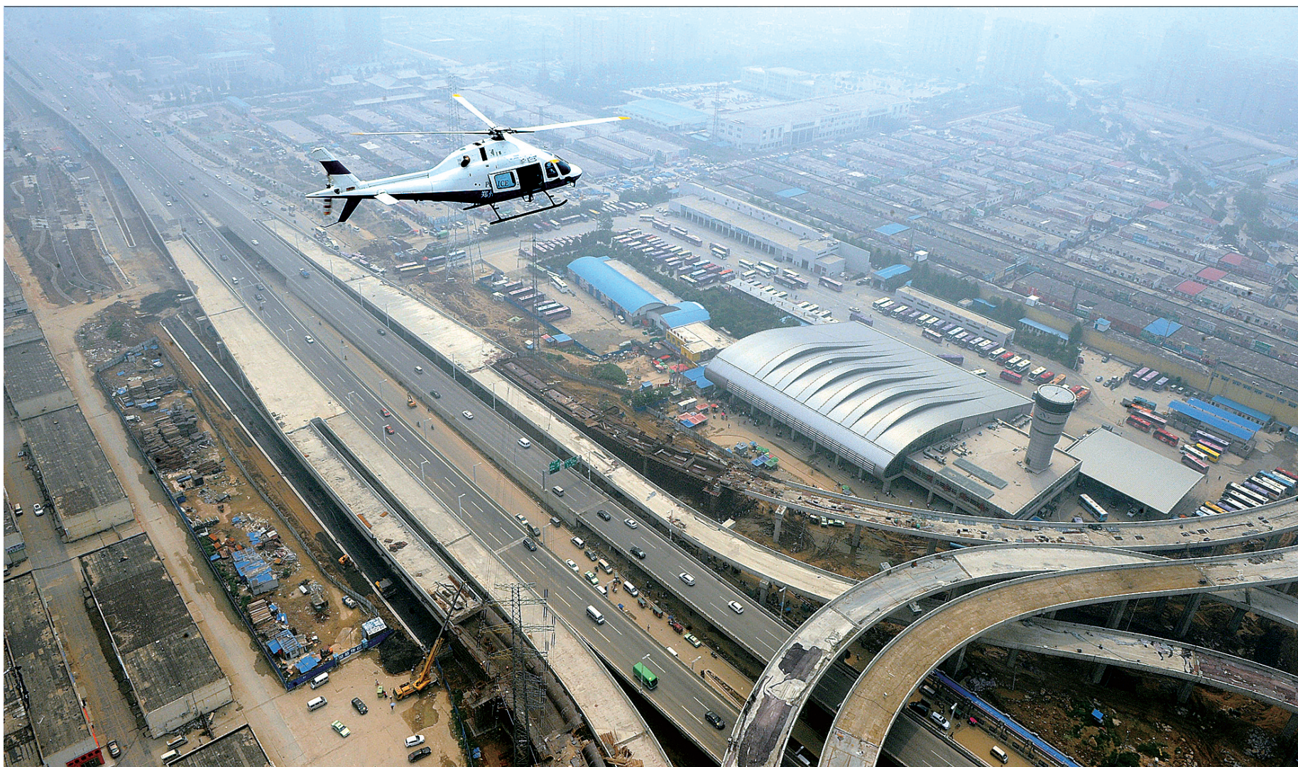
铁网猎鹰 2014年8月11日,郑州警方为升级、强化现有街面武装巡逻体系,持续对违法犯罪活动保持高压严打态势,根据省会警方“铁网”行动整体部署,警方3架警用直升机被纳入“铁网”巡逻防控体系,实施重点区域空中武装巡逻、常态化空中警戒,构建空地一体化的严打防控体系。