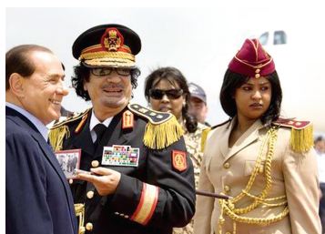
卡扎菲喜欢使用女保镖。