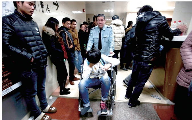
腿部受伤的学生被紧急送往医院救治