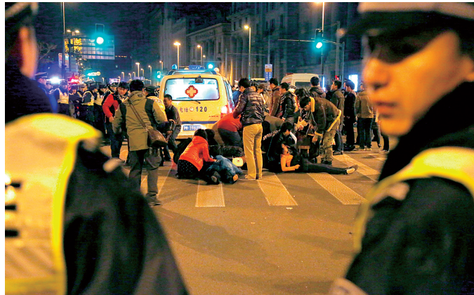
120车抵达现场,展开救治