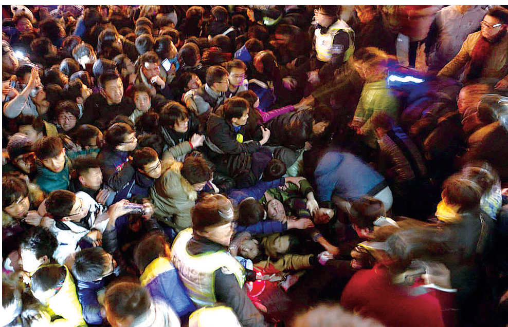
事发现场拥挤的人群

记者从多个渠道获悉,伤亡者中以年轻女性居多,有包括复旦大学在内的高校学生,也有儿童。