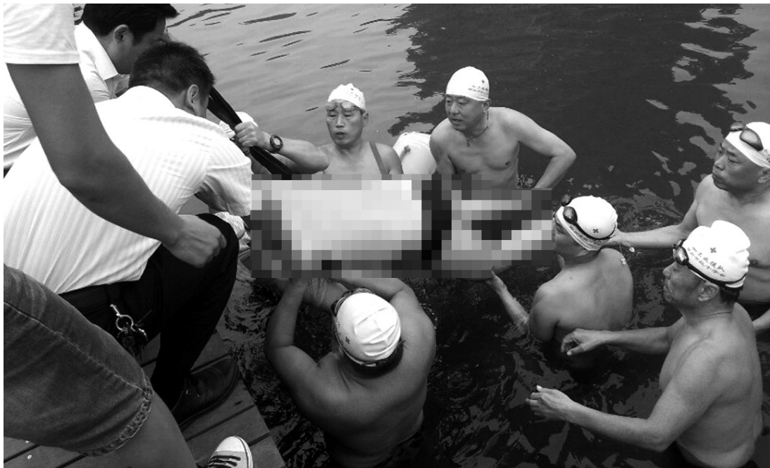
2013年9月4日,在东区如意湖,市红十字水上义务救援队队员成功打捞出一名溺水者。