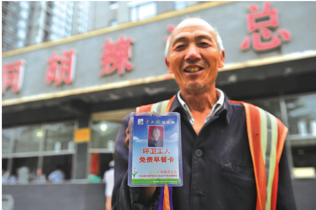
方大同胡辣汤店给环卫工办胸卡,大家凭卡可在4店免费就餐