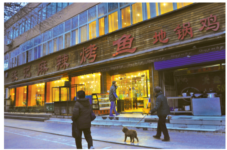
政四街上还在坚持献爱心的张记麻辣烤鱼