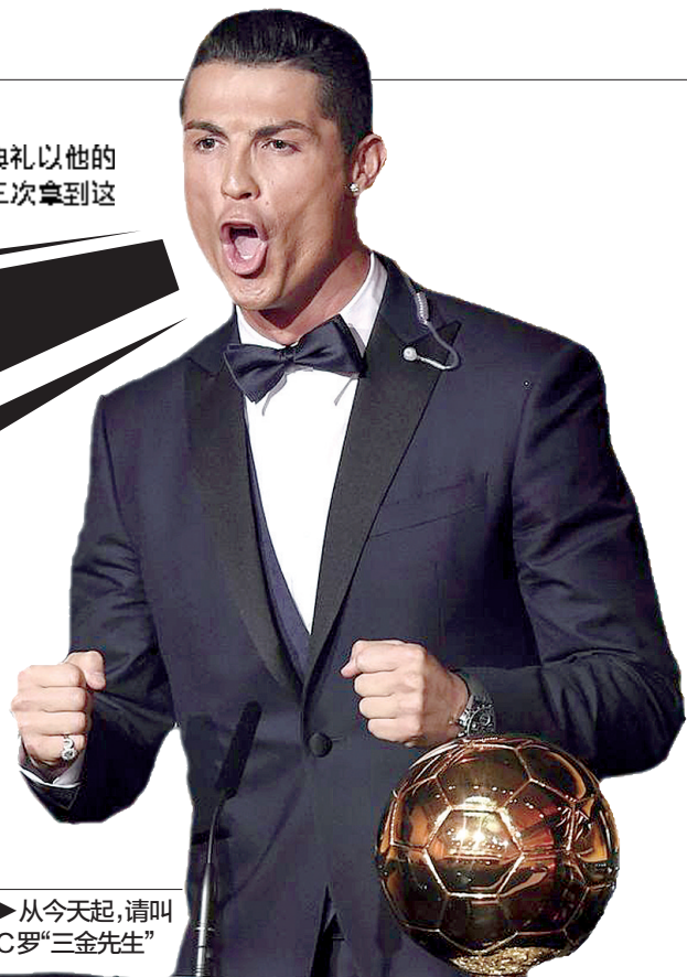
▶从今天起,请叫C罗“三金先生”

自2008年以来,C罗和梅西包揽了7届世界足球先生大奖。不可否认,两人是当今世界足坛最具号召力的球星。由于世界足球先生评选缺乏具体标准,因而各队主教练、队长和媒体代表在评选时往往更看重人气。即便如此,如果C罗和梅西无法拿到世界杯冠军,无论他们再拿多少次世界足球先生大奖,也无法比肩贝利、马拉多纳、齐达内、罗纳尔多。