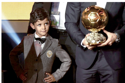
一手金球,一手萌娃,人生赢家